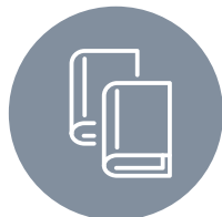
SCHULEN UND UNIVERSITÄTEN